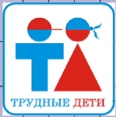
Темы личных запросов